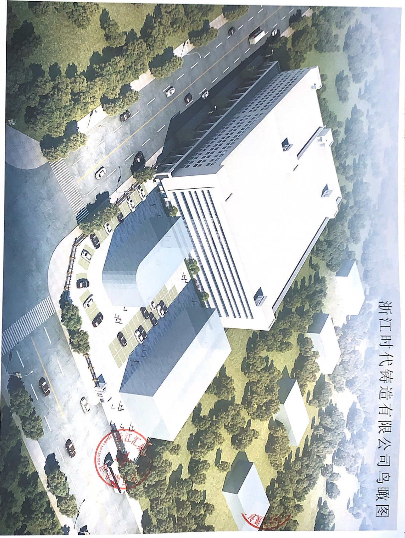
浙江时代铸造有限公司鸟瞰图